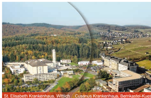
St. Elisabeth Krankenhaus, Wittlich Cusanus Krankenhaus, Bernkastel-Kues

Verbundkrankenhaus Bernkastel / Wittlich