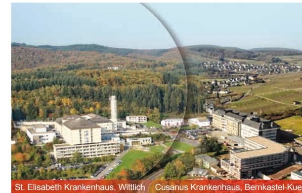
St. Elisabeth Krankenhaus, Wittlich Cusanus Krankenhaus, Bernkastel-Kues

Eine Teilnahmebestätigung erhalten Sie nach Eingang Ihrer verbindlichen Anmeldung.